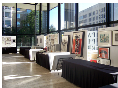
Papier en 2007

Papier a vu le jour dans l'un des impressionnants bâtiments conçus par l'architecte Ludwig Mies Van der Rohe, le Westmount Square. L'événement, qui s'inscrivait alors dans la programmation des Journées de la culture , regroupait 17 galeries, 2 500 visiteurs et 150 invités lors de sa première soirée d'ouverture-bénéfice VIP. Au fil des années, la foire Papier a connu un succès grandissant, rassemblant un public toujours plus nombreux d'amateurs d'art et de collectionneurs aguerris. Forte de cette popularité, Papier occupa plusieurs espaces à travers la métropole afin d'être en mesure d'accueillir un nombre sans cesse croissant d'exposants et de visiteurs qui affluent année après année.