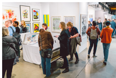
Papier en 2017